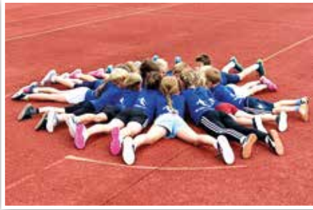
Filmdreh für Sterne des Sports