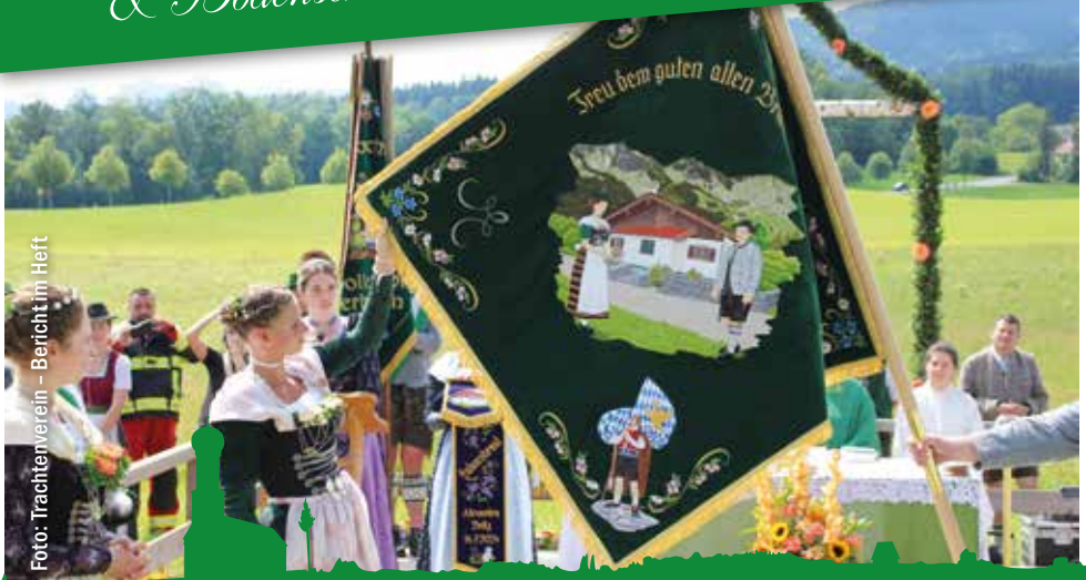
Bericht im Heft

Fahnenweihe des Trachtenvereins Schmied von Kochel & Bodenschneid Waakirchen-Hauserdörf