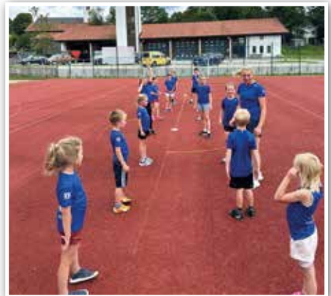
Wir trainieren bei jedem Wetter