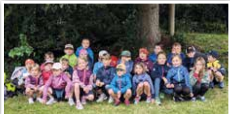
U10 und U8 beim Schlosslauf