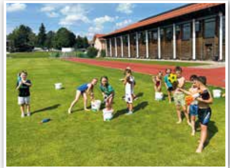
Vor den Ferien Eis und Wasserschlacht